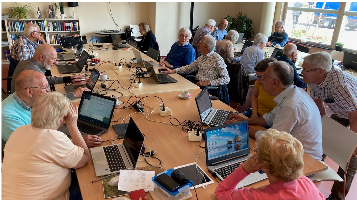
Computer Vereniging Bollenstreek / Haarlemmermeer bijeenkomst mei 2022